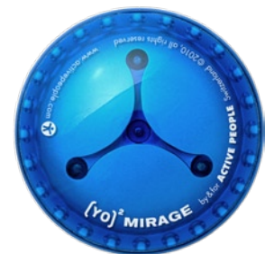
[YO] 2 MIRAGE