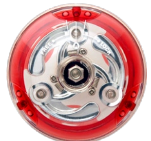
[YO] 2 TRIPLE MOON