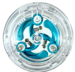
[YO] 2 TRIPLE ACTION

Für Bilder in Druckauflösung senden Sie bitte eine Email an press@activepeople.com .